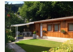
Le jardin privatif et sa terrasse équipée

Récemment achevé, le nouveau gîte familial vous offre un accueil très confortable dans un environnement résolument moderne et chaleureux. Deux chambres doubles et une vaste pièce à vivre avec une cuisine entièrement équipée sont à votre disposition pour un séjour en famille réussi ! Toutes les pièces sont climatisées et une terrasse couverte vous permettra de profiter du barbecue !