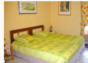
Deux lits jumeaux confortables

Spacieuse et lumineuse, la chambre de 20 m 2 s'ouvre sur la montagne et le col de Ste Marie-aux-mines. Elle est équipée de deux confortables lits jumeaux. Le coin bureau comprend tout l'équipement nécessaire à votre séjour : frigo, cafetière, accès internet, TV satellite et bibliothèque. Une grande salle de bain est également à votre disposition avec baignoire et douche.