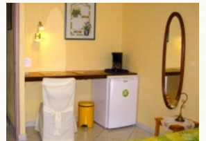
Le coin bureau équipé