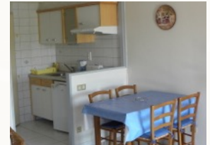
La cuisine équipée et le coin repas pour 4 à 6 personnes