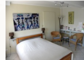
Un couchage confortable et le coin salon idéal pour se détendre

Confortablement meublée, baignée par la lumière naturelle, la pièce principale de 20 m 2 s'ouvre sur la vallée. Elle est équipée d'un confortable lit double. La cuisine comprend tout l'équipement nécessaire à la préparation des repas : réfrigérateur-congélateur, plaque de cuisson, hotte, mini-four et micro-onde. La vaisselle et les ustensiles sont fournis. Une douche spacieuse, les toilettes et divers rangements complètent la salle d'eau.